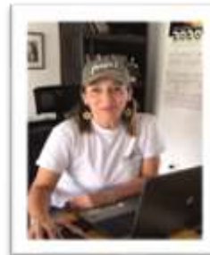
Sede Regional Arauca

Link video: https://www.youtube.com/watch?v=_JmIPICwgew&feature=youtu.be