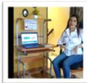
Coordinación Regional Tolima