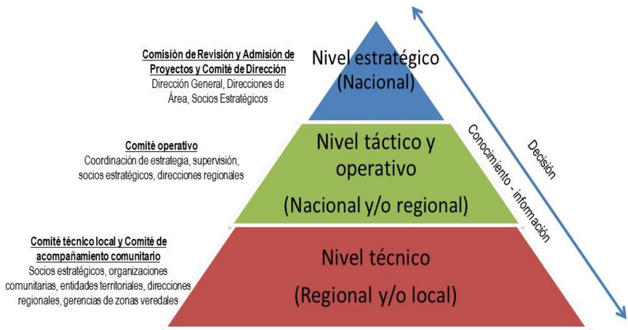
Figura No 2. Niveles de las instancias de decisión, coordinación y seguimiento