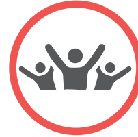
Organizaciones sociales, comunales y comunitarias