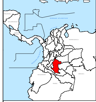
Localización Municipios de la Región: MACARENA RÍO CAGUÁN

Limites Marinos y Terrestres REGIÓN MACARENA RÍO CAGUÁN