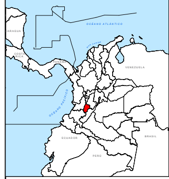
Localización Municipios de la Región: CORDILLERA CENTRAL