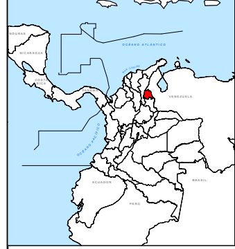
Municipios de la Región de: CATUMBO